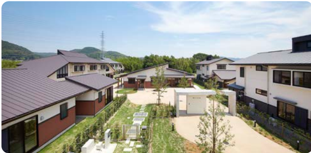
生活クラブ風の村はくみの杜君津(児童養護施設)