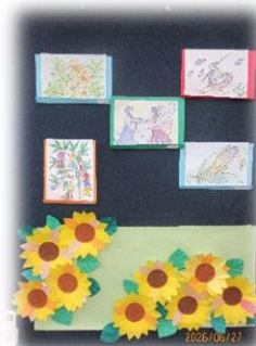
【今月の壁画：ひまわり】

6月は、ゲームなど室内での活動が多くありました。また日中はお仲間同士で本を見たり、お話をしたりする場面も多く見られています。