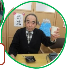
～ 乾杯 ～