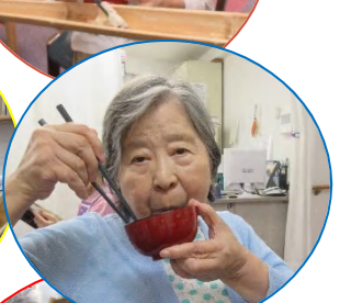
流しそうめんの様子