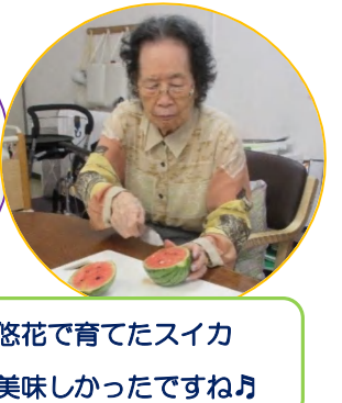
悠花で育てたスイカ 美味しかったですね♪