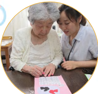
可愛いカレンダーが出来ました♪