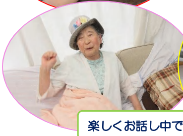
楽しくお話し中です♪♪