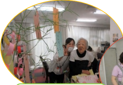
短冊の願い事 叶うといいですね☆