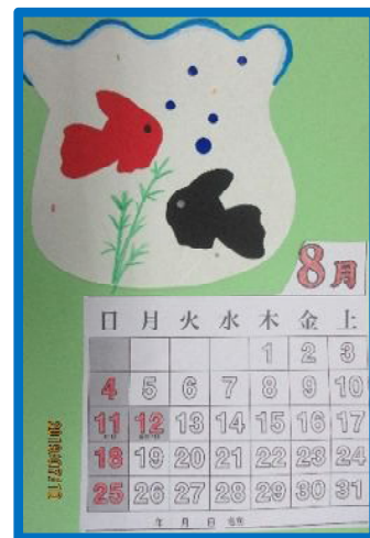
【8月のカレンダー：金魚】

流しそうめんでは、皆さんさらさらと流れてくるそうめんを上手にお箸ですくっておられました。