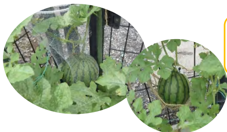
小玉スイカが 2個出来ました♪