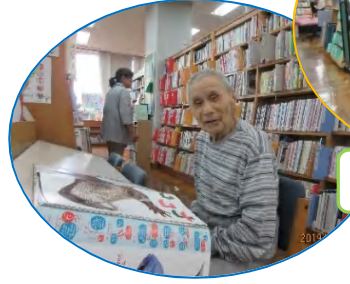
図書館で本を選びました♪