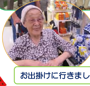
お出掛けに行きました！