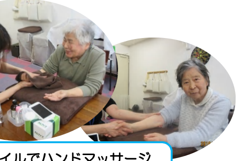
アロマオイルでハンドマッサージ。 「気持ちいいね〜」