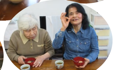
寒い日はみんなでお料理。 「お味はいかが?」「グーです!」