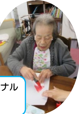
色を塗って焼いたらオリジナル プラ板の出来上がり!