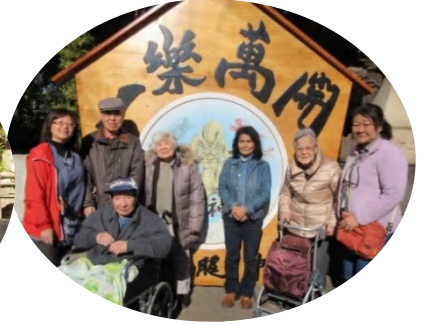
田無神社で初詣。今年も良い年でありますように。