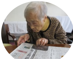
「いろんな記事が載ってるね」