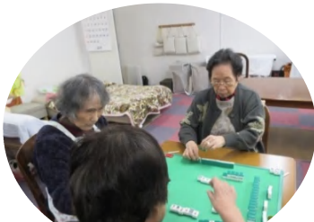
麻雀は頭の体操です。