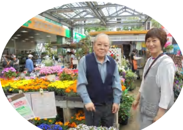
次に植える花を選びに来ました。