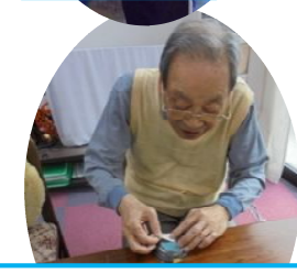
オリジナル紙皿作り。「こんな感じかな？」