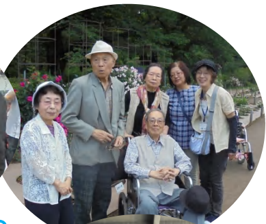
神代植物園のバラフェスタに行ってきました。