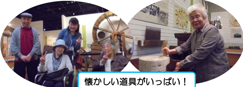
懐かしい道具がいっぱい！