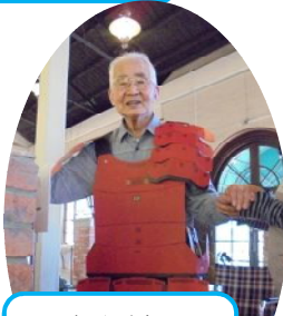
甲冑を着てはいチーズ