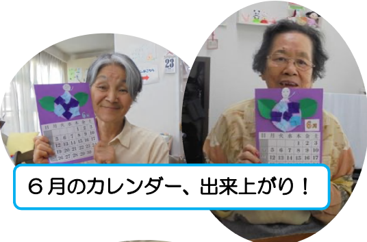
6月のカレンダー、出来上がり！