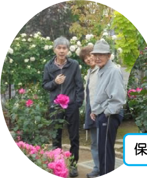
保谷ローズガーデンにて