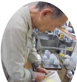
見事な包丁さばき！