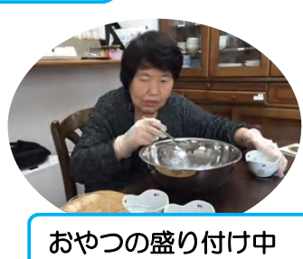
おやつ盛り付け中