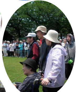
視線の先は 運動会！