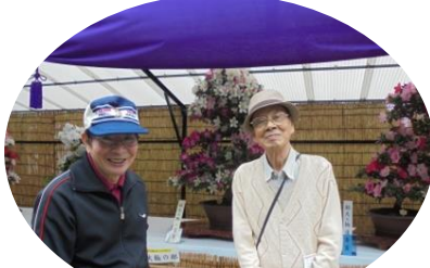
サツキの花も綺麗でした