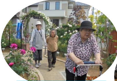
噂のローズガーデン！