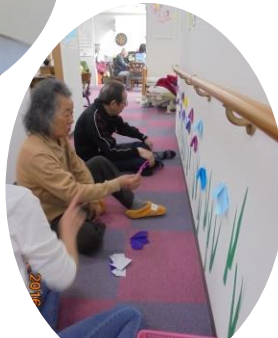
座り込んで廊下 の壁画も作成中