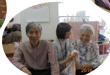
何だか楽しそうですね