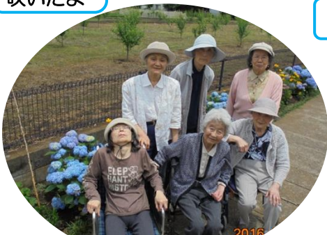
きれいに咲いたアジサイと