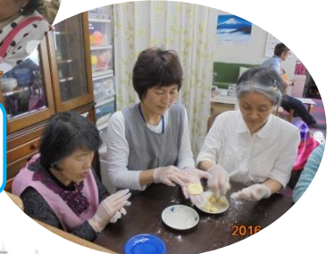
皆で作ったお饅頭。 おいしかった！