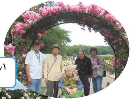
バラにも負けない 美男美女