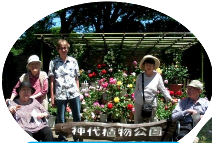
今年も行ってきました 神代植物公園！