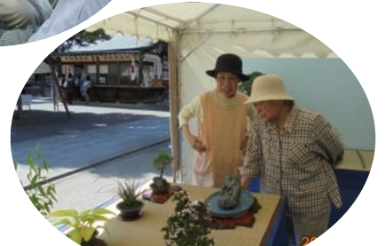
かわいい盆栽だね