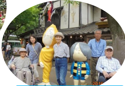
深大寺にも足を延ばし…