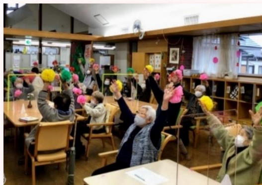
体操も華やかに 楽しく!!