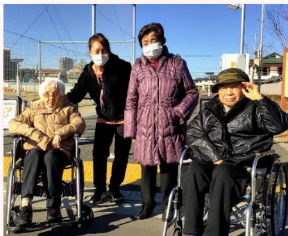
晴れた日は公園へ 散歩に行きました♪