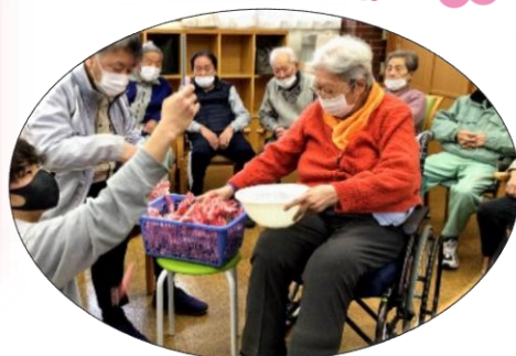
お正月なのでカルタやすごろくも!!