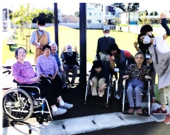
公園のベンチで一休み♪