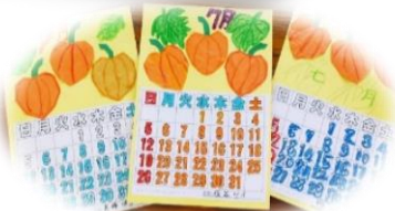
ほおずきカレンダー