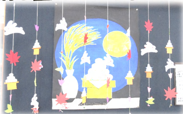
お月見の絵とウサギのつるし飾り。