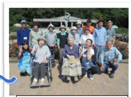
神代植物園でバラ鑑賞