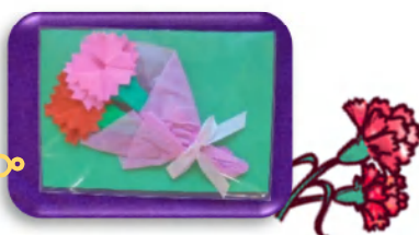
カーネーションの花束を作りました