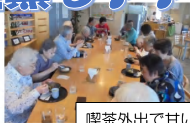
喫茶外出で甘いもの♪