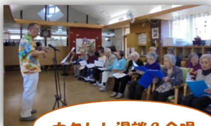
ウクレレ漫談&合唱