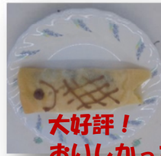
大好評！ おいしかった～