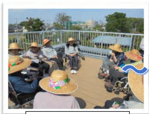
屋上でティータイム