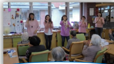
コーラス「コーロ・フィオーレ」