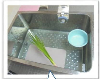
菖蒲湯で邪気払い

5/3～5の3日間は菖蒲湯を楽しんで頂きました。5日は皆さんと職員で力を合わせてかわいい鯉のぼりのお菓子を作りました。