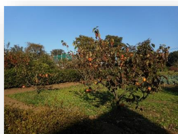
いずみの向かいの畑の柿も食べごろの様です

紅葉が見ごろを迎える季節になりました。 まだまだ寒暖の差が続きますので、体調を整え紅葉狩りなど秋を満喫しましょう。