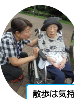
散歩は気持ちいいですね。