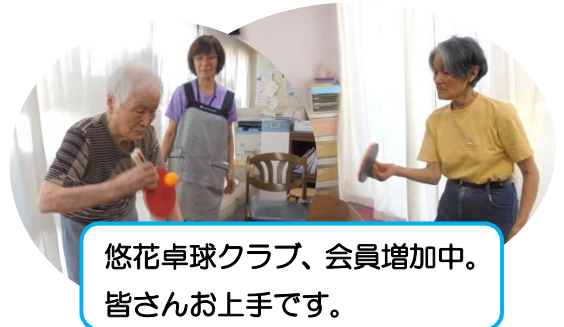
悠花卓球クラブ、会員増加中。皆さんお上手です。