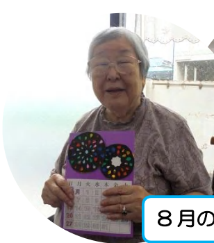
8月のカレンダーは花火です。