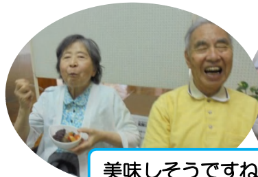
美味しそうですね。