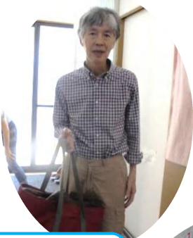
「お弁当取ってきたよ」