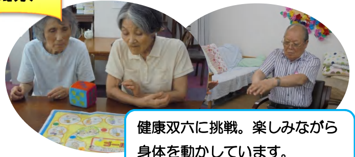
健康双六に挑戦。楽しみながら身体を動かしています。