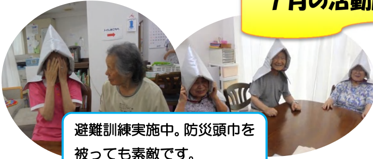
避難訓練実施中。防災頭巾を被っても素敵です。