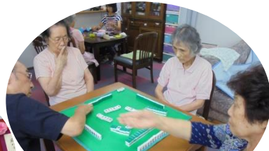
皆さん勝負師ですね。