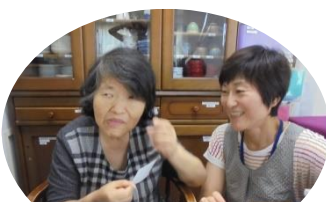
新しい手芸に挑戦中。