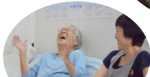
大笑い！なんだか 楽しそうですね。