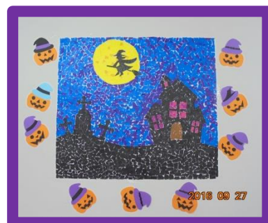
【10月の壁画：ハロウィン】