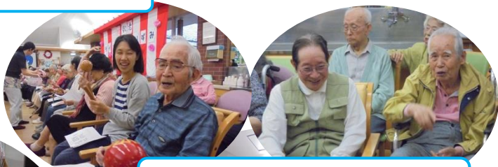
いずみの敬老会に参加しました。