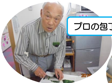
プロの包丁さばき。