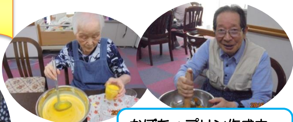
かぼちゃプリン作成中。 男性も頑張ります！