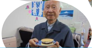
カフェ悠花へようこそ。