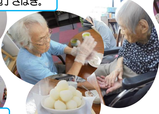
お月見団子をつくりました。